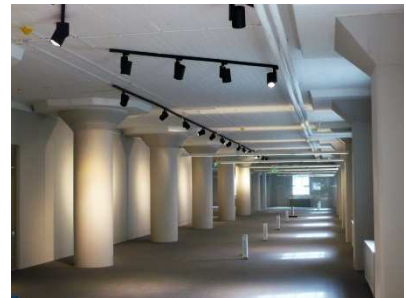
Grönstedtska palatset, Academic Work