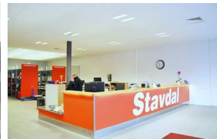
Kolsva 1, Stavdal