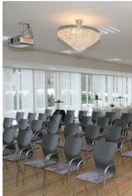
Barkarby Gärd, LasseMaja