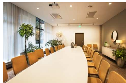
Kv Lönner 24, Sturegatan 15