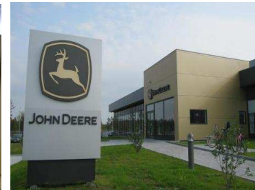
John Deere, Märsta