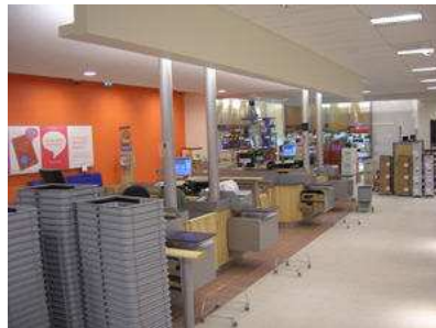
26 st Systembolagsbutiker