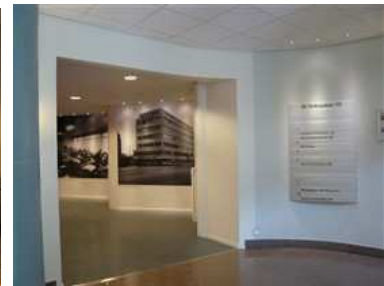
Kv Härden, St: Eriksgatan 113