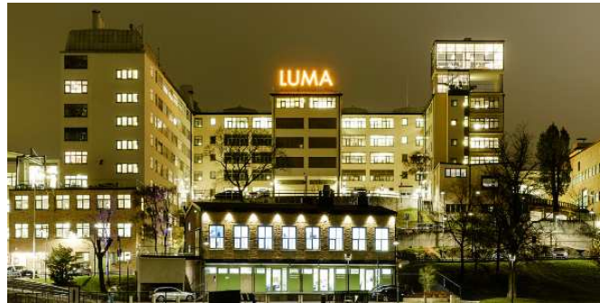
Erco, Villa Aktuellt, Luma hus 26, Swe Fitness