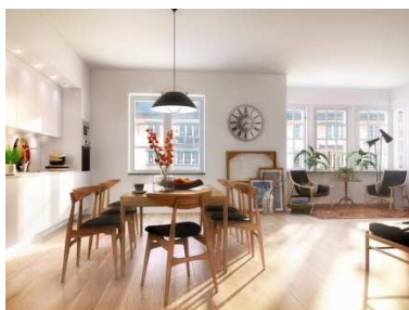
Kv Såpsjudaren 14, BJK 53, Bostäder